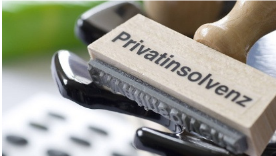
130.000 Deutsche mussten 2012 Privatsolvenz anmelden

17.05.2013, 15:04 Uhr | AFP, t-online.de, dpa-AFX